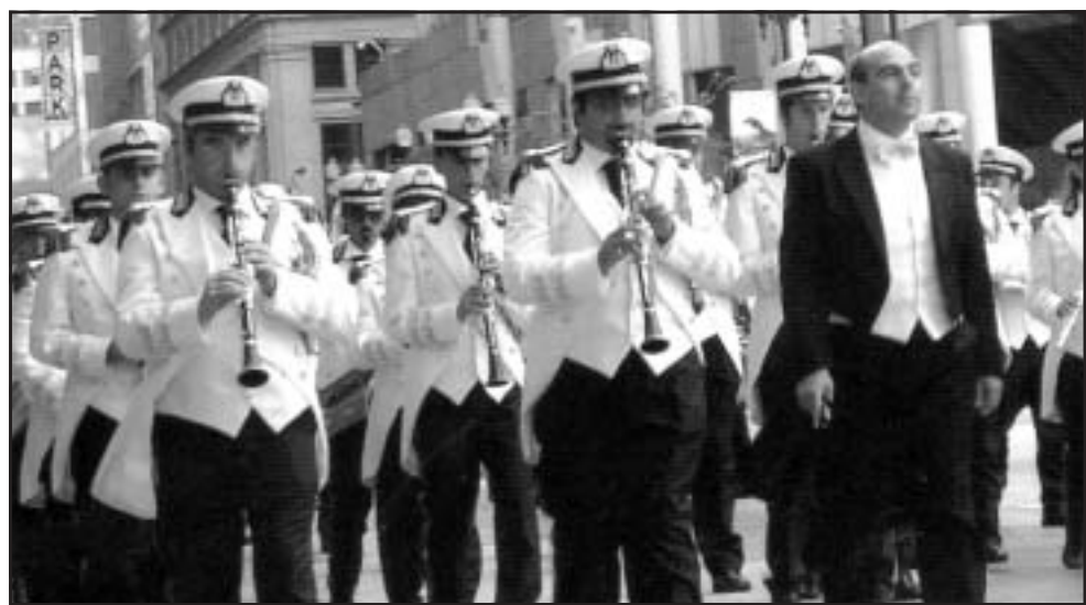
La banda Ligonzo di Conversano ospite al Columbus Day di Chicago